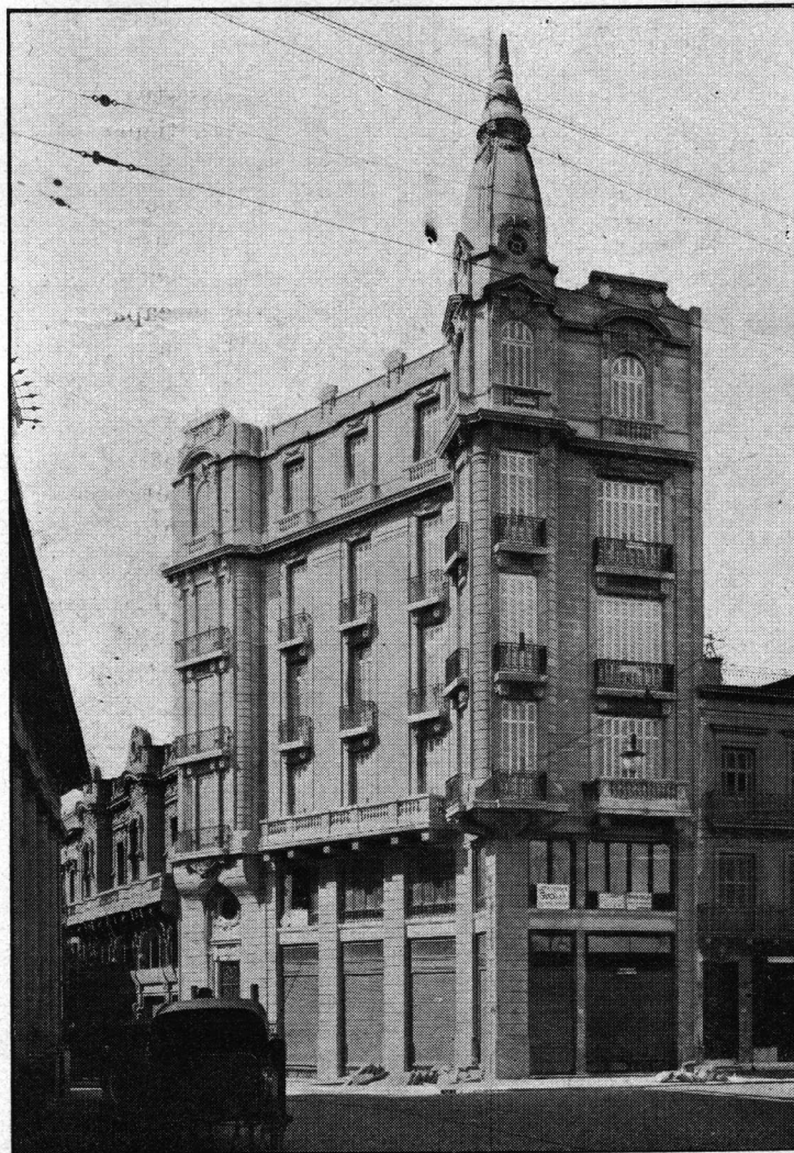
Edificio de Renta: plaza Independencia esq. Juncal