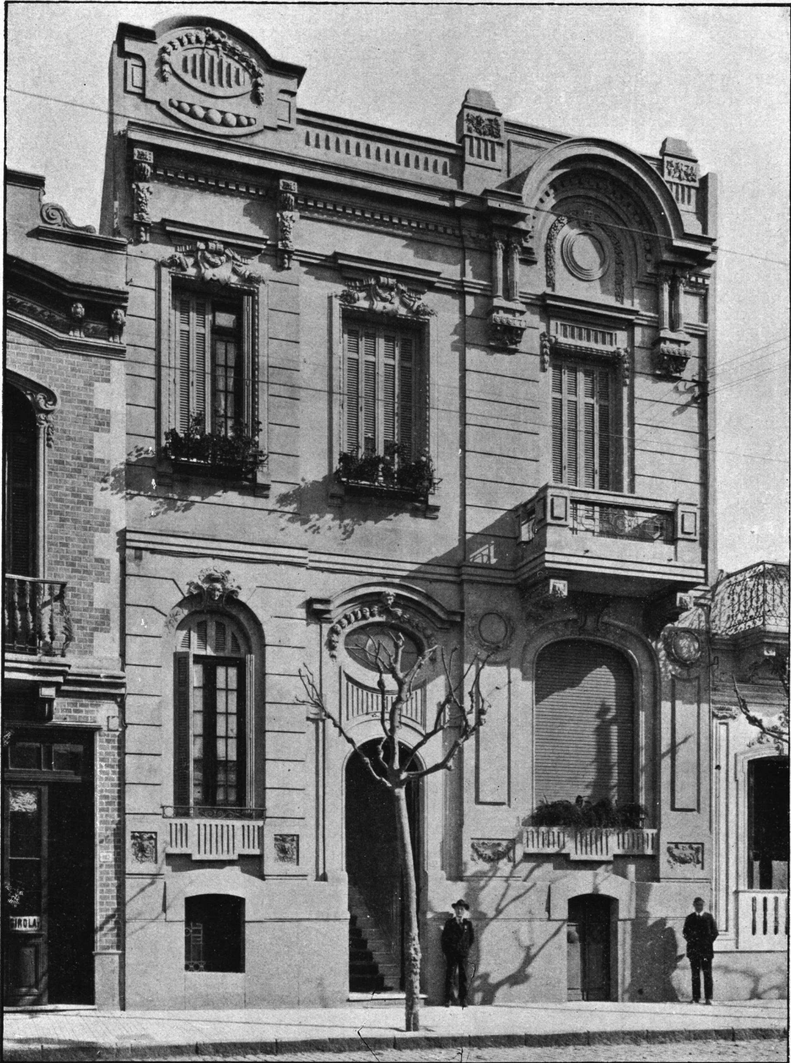
Casa-habitación, -- Calle Mercedes.