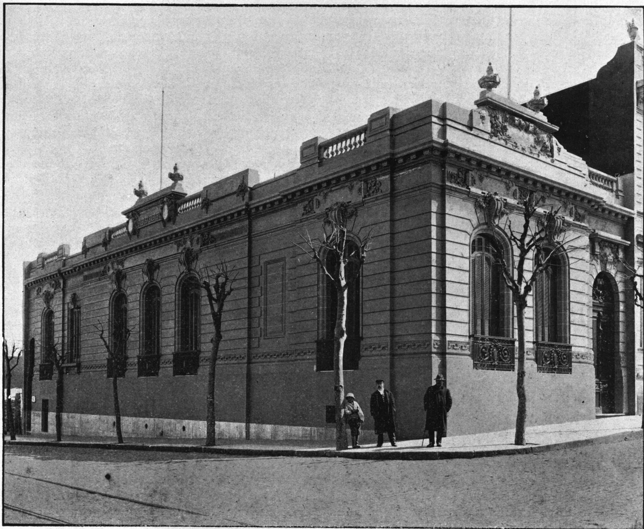
Casa-habitación. -- Calle Canelones y Cuarein.