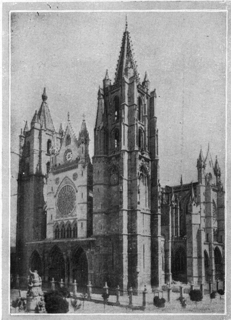
Catedral de León

parte el proyecto de modificaciones al reglamento municipal de construcciones que aquí reproducimos, creemos oportuno llamar la atención de los profesionales sobre él, pues sería muy conveniente sea estudiado este proyecto con la debida detención y se les hicieran con