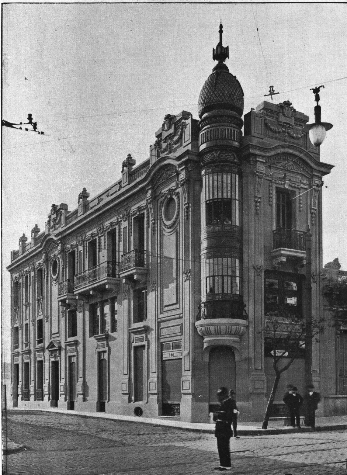
Casa de Renta — Calle Agraciada