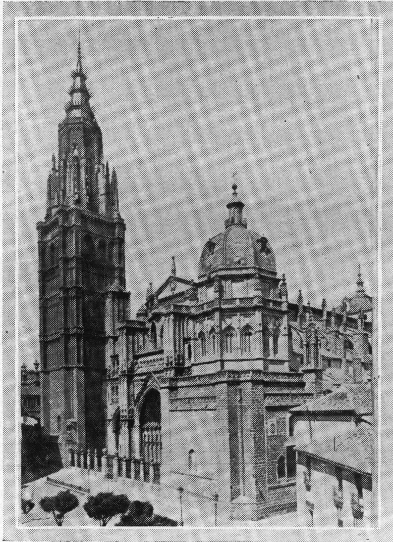
Catedral de Toledo

Artículo 1o. — La municipalidad de la capital no podrá permitir edificación urbana alguna cuya distribución o disposición arquitectónica, pueda perjudicar las servidumbres de aire y de luz en las construcciones vecinas.